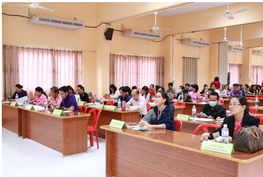
กิจกรรมประชุมประจำเดือน ทบทวน และปรับปรุงแนวทางการปฏิบัติงาน