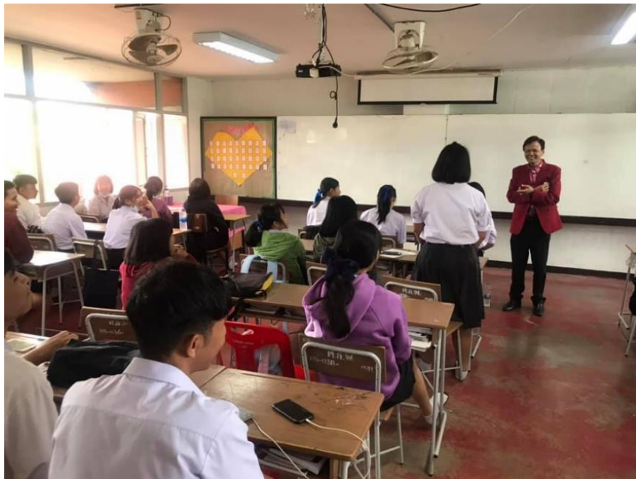
กิจกรรมโฮมรูมปลุกฝังคุณธรรมก่อนเริ่มวิชาเรียน