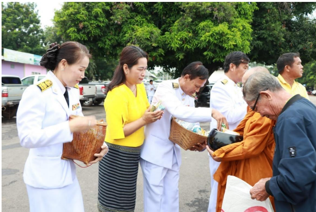
กิจกรรมทำบุญตักบาตรเนื่องในวันสำคัญ