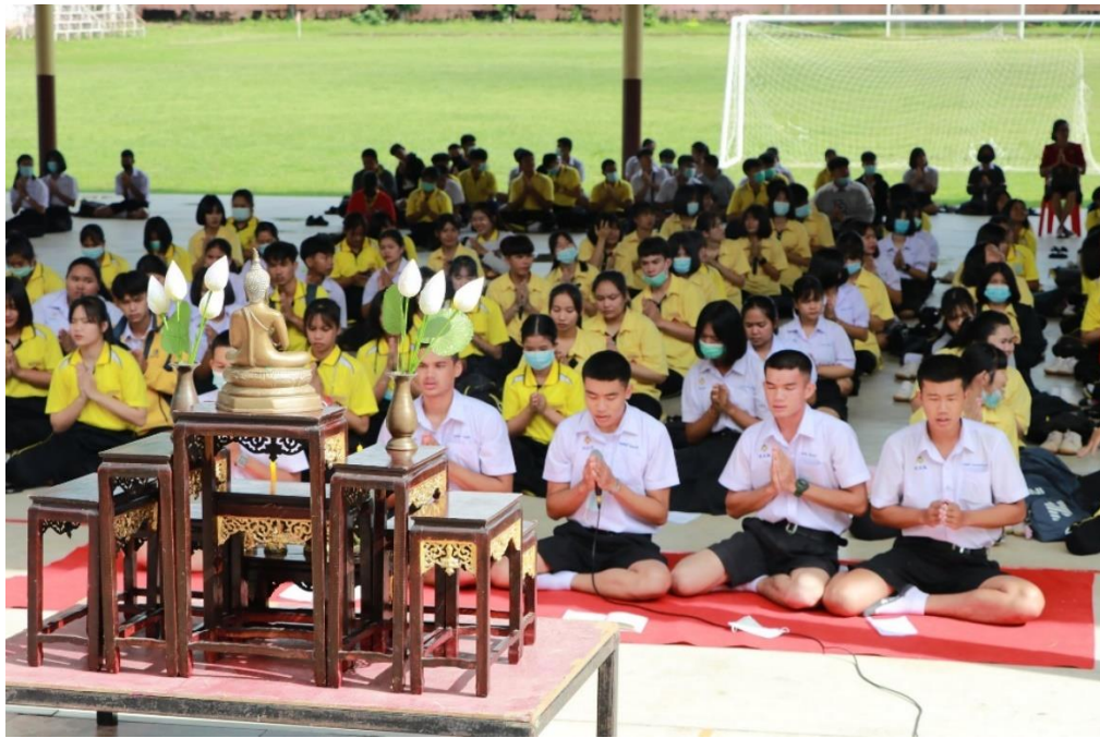
กิจกรรมสวดมนต์ไหว้พระประจำสัปดาห์