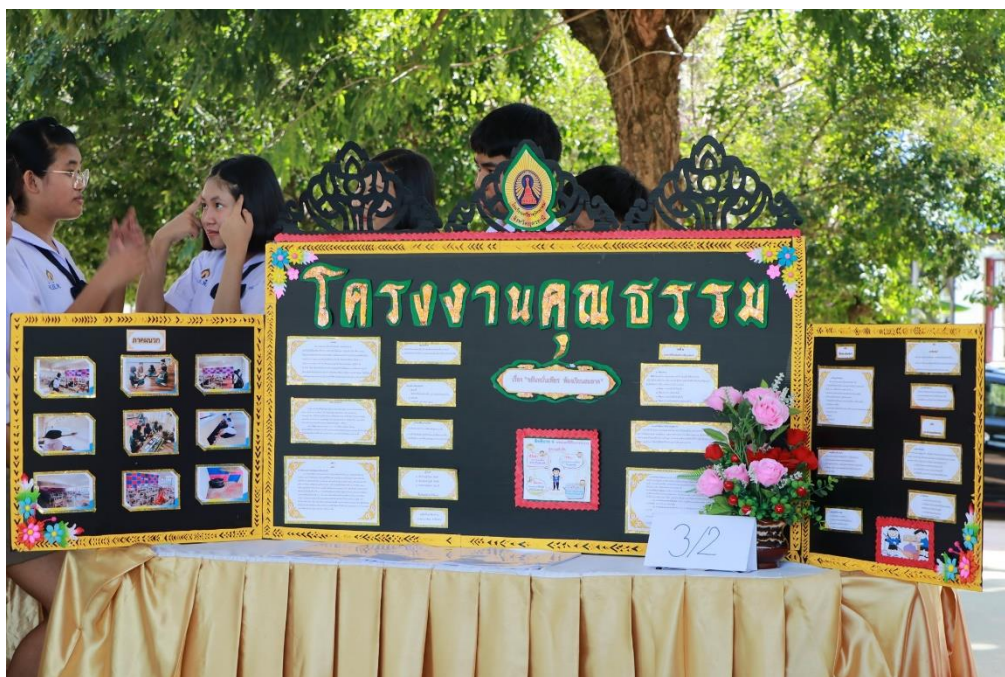
กิจกรรมประกวดโครงการคุณธรรม