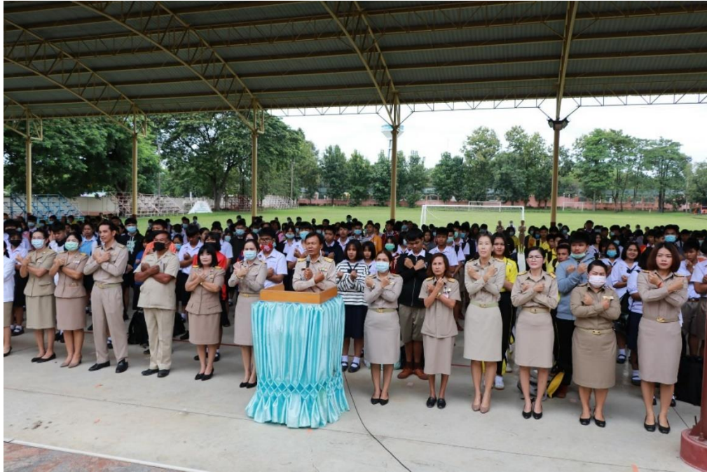
กิจกรรมกล่าวคำปฏิญาณโรงเรียนสุจริต